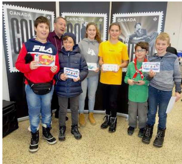
En plus d'un bon d'achat de 2$, les jeunes philatélistes de la relève venus nous visiter ont tous reçus un prix de présence ainsi que des enveloppes de timbres du monde.