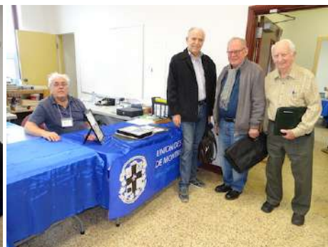
Les visiteurs ont été accueillis chaleureusement par les bénévoles de l'UPM. Ils étaient nombreux à attendre l'ouverture de l'exposition.