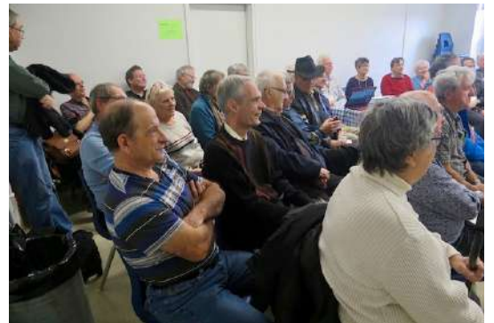
Une quarantaine de personnes ont assisté à la conférence : Les papiers utilisés pour imprimer les timbres canadiens.